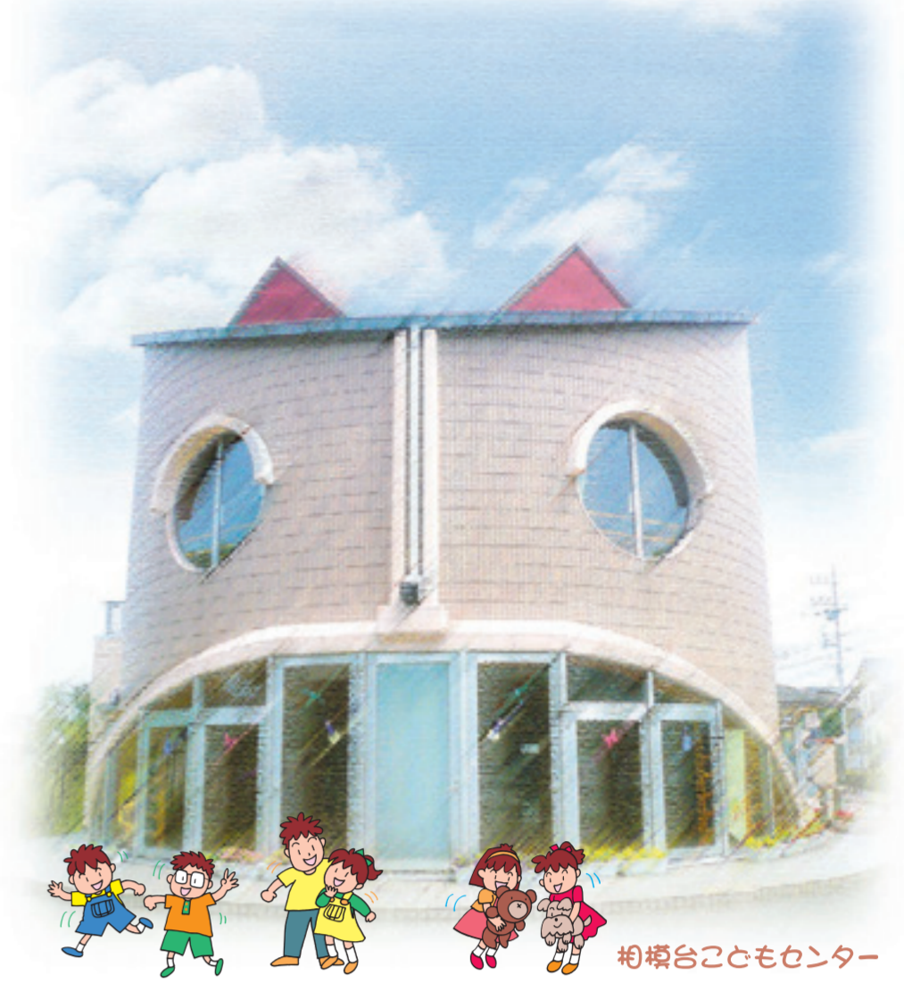
発行 相模台地区社会福祉協議会 南区相模台1-13-5(相模台まちづくりセンター内) ☎ 744-3148 [発行日] 平成28年3月