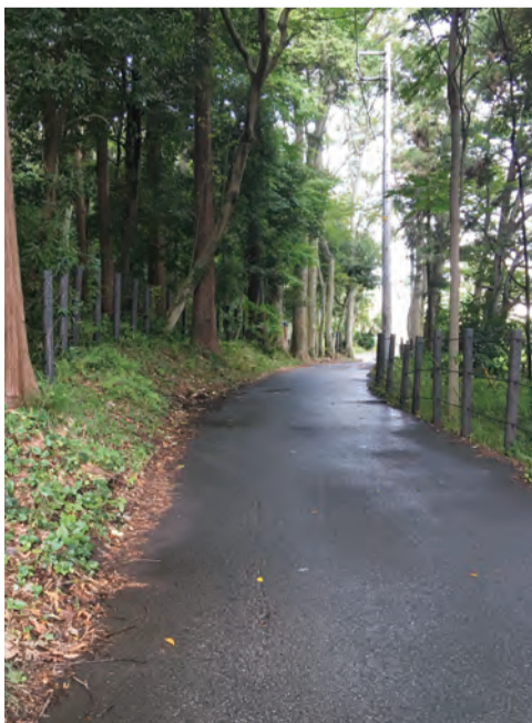
今も残る鎌倉街道の面影