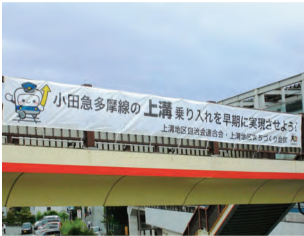
上溝駅前に横断幕を設置

そのため、上溝地区では、JR上溝駅前の歩道橋に「小田急多摩線の上溝乗り入れを早期に実現させよう」という横断幕を設置しました。