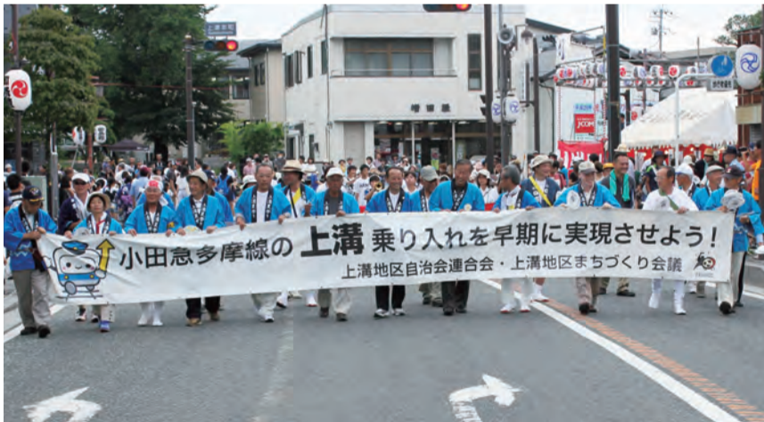
上溝夏祭りパレードにて多くの来場者にPR

また、市との共催による地区まちづくり懇談会におきましても、横断幕を掲げるとともに、本年の上溝夏祭りでは、上溝地区自治会の会員やまちづくり会議のメンバーなどでの横断幕を掲げ、パレードを行うなど、祭りに来場された地区内外の方々に、積極的に計画の推進・早期実現についてアピールを行いました。