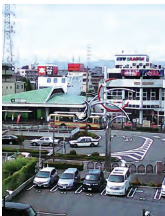
新市街地のシンボル古淵駅

一方で、新しい古淵もあります。1988年3月にJR横浜線「古淵駅」が開業し、同時に駅を囲むようにまちづくりが進められ、商業ビルなどが立ち並び「新市街地」が形成されました。