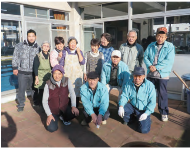
県営大島団地自治会のみなさん