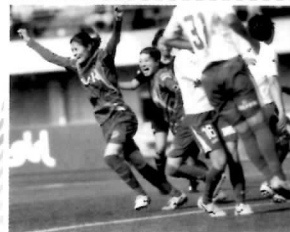
©Nojima Stella Kanagawa Sagamihara

ことしの共同募金運動は、引き続き「つながりをたやさない社会づくり」を全国共通テーマに掲げて、緊急的な対応が求められている社会的課題への支援事業や災害支援事業とともに、引き続き、神奈川県内の地域福祉活動を推進してまいります。