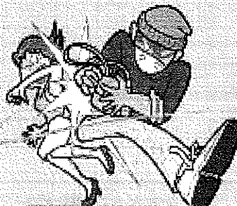
路上のひったくり