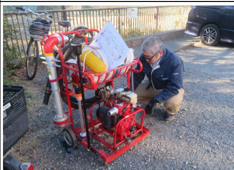
D級ポンプ点検の様子

器具のメンテナンスと隊員のスキルアップを目的として、毎月発電機、チェンソーやD級ポンプなどの点検を緑が丘2丁目公園防災倉庫周辺に於いて実施しており、 隊員9名 が参加しました。また本日は、器具点検終了後にスポーツ広場に移動して 礼式訓練 も実施しました。