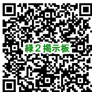
緑2・掲示板QRコード