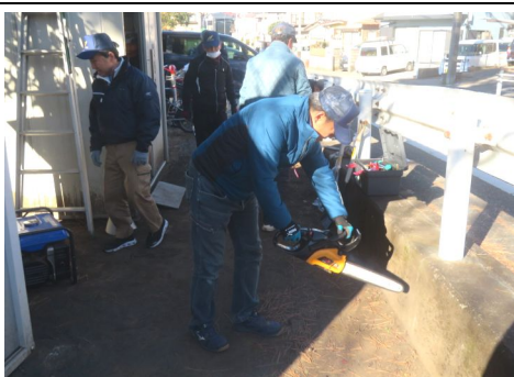
チェンソー点検の様子