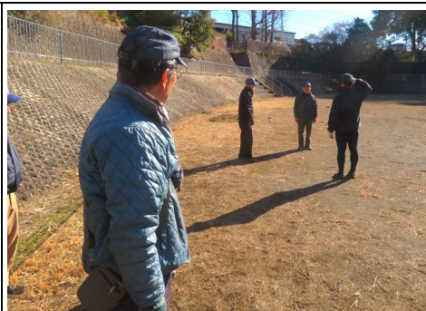
スポーツ広場での礼式訓練の様子