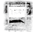
足柄万葉公園 夕日の滝