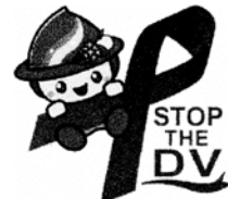
相模原市マスコット キャラクターさがみん

※DVは、男女ともに被害者となる可能性があります。令和4年度に、相模原市が市内在住の18歳以上の方を対象に実施した調査では、女性では22.2%、男性では9.9%がDVの被害を受けた経験があると回答しています。