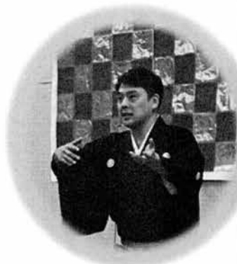
真打 春風亭 昇吉師匠