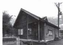
自然の家 城山観光センター