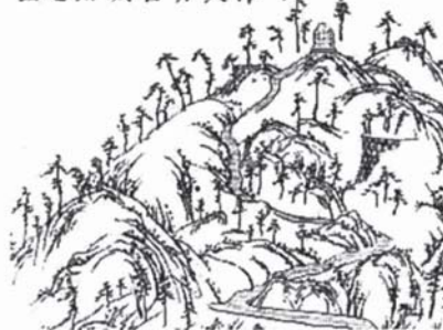
新編相模国風土記稿に描かれた津久井城址