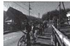
昨年の e-bike モニターツアーの様子