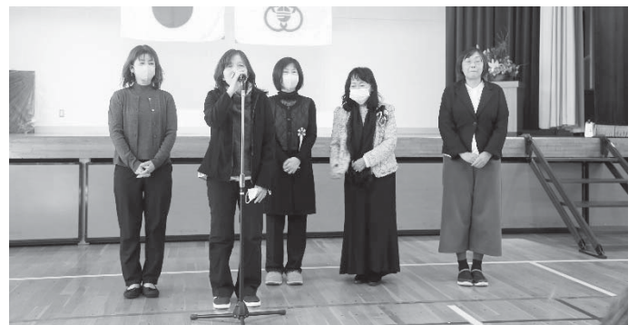
<独立・自主防災隊>