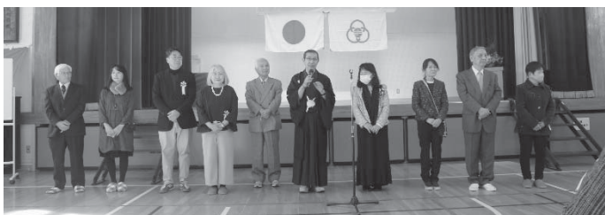
<光が丘地区民生委員・児童委員協議会>