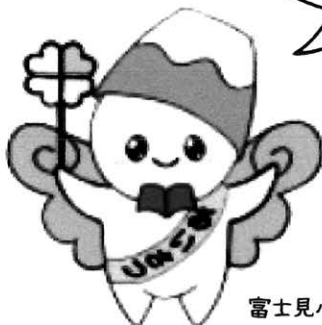
富士見小マスコットキャラクター 「ふじくん」

お家の近くなどで見守って いただくだけでも うれしいです。 気軽にお問い合わせください